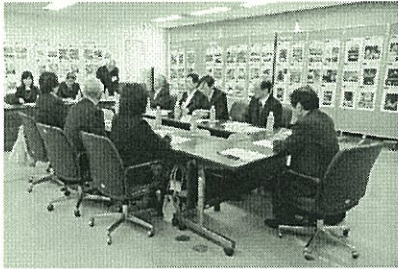
写真・書類選考風景