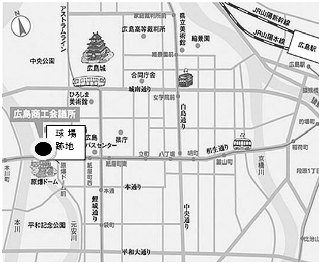
広島商工会議所の付近見取り図